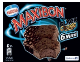
Mpk Mini Maxibon Black Cookie 372 gr