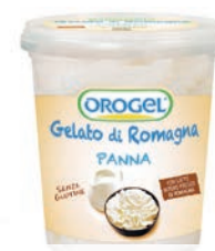
Barattolo Panna Orogel 400 gr