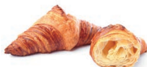
Croissant Vuoto Maison Heritage Delifrance 70 gr