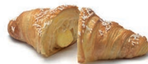
Gran Croissant alla Crema Burè S. Giorgio 90 gr