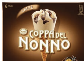
Mpk Cono Coppa del Nonno x6 420 gr