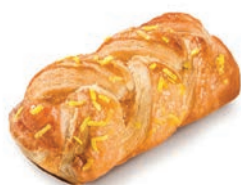
Intreccio Limone e Zenzero Alemagna 83 gr