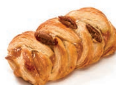
Treccia Noci Pecan al Burro Alemagna 100 gr