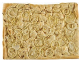
Focaccia Cipolle Fornaio Maccalli 650 gr