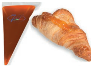
Farcicocca 1000 gr