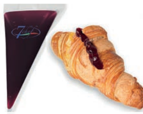
Farcibosco 1000 gr