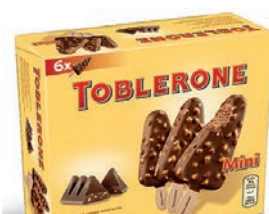
Mpk Mini Stecchi Toblerone 350 gr