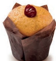
Mini Muffin Mirtilli Alemagna 30 gr