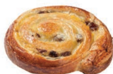
Giruvetta al Burro Alemagna 100 gr