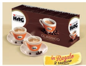
New Hag Bar 5 gr