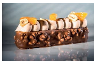
Fashion Albicocca e Nocciola La Donatella 100 gr