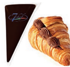
Farcitura Ciocco Dark 1000 gr