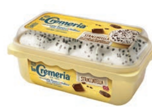
Vaschetta Cremeria Stracciatella 500 gr