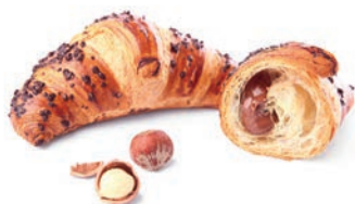
Croissant al Cioccolato e Nocciole Delifrance 90 gr