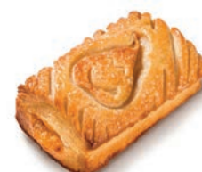
Sfogliatina Ricotta e Pere Alemagna 89 gr