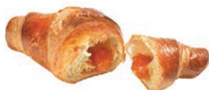
Croissant Albicocca al Burro Alemagna 90 gr