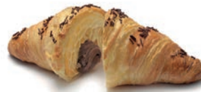
Gran Croissant Ciok Burè S. Giorgio 90 gr