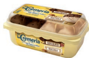
Vaschetta Cremeria Cioccolato/Nocciola 500 gr