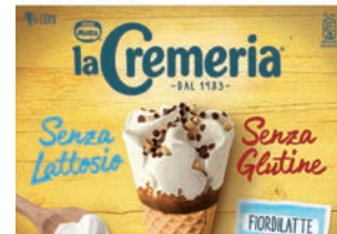
Mpk Cono Cremeria senza Lattosio e Glutine 500 gr