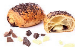
Fagottino ai 3 cioccolati Delifrance 100 gr