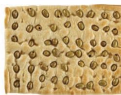
Focaccia Olive Fornaio Maccalli 650 gr