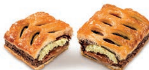
Sfoglia Cocco e Nocciola Alemagna 77 gr