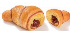
Cornetto Bicolore Frutti di Bosco Alemagna 87 gr