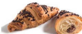
Croissant Crema Nocciola Vandemoortele 90 gr