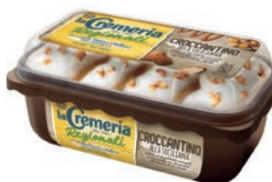
Vaschetta Cremeria Croccantino alla Siciliana 500 gr