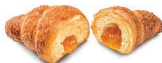
Cornetto Plus Arancia Alemagna 87 gr