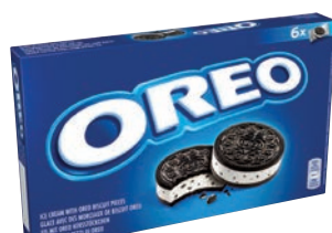
Mpk 6 Biscotti Oreo 198 gr