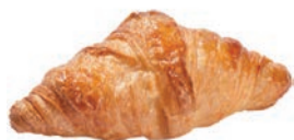
Croissant Vuoto al Burro Alemagna 75 gr