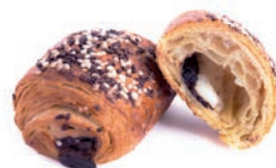
Fagottino al Cappuccino Delifrance 85 gr