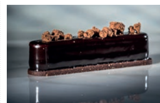
Fashion al Cioccolato La Donatella 100 gr