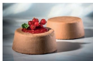
Mousse al Cioccolato La Donatella 90 gr