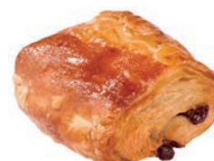
Fagotto Cioccolato al Burro Alemagna 75 gr