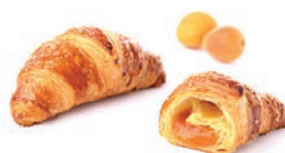
Croissant all'Albicocca al Burro Delifrance 90 gr