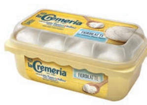
Vaschetta Cremeria Fiordilatte 500 gr