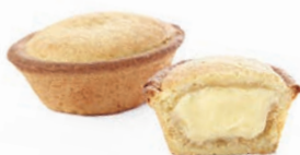
Pasticciotto alla Crema Delifrance 60 gr