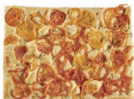
Focaccia Pomodori Fornaio Maccalli 650 gr