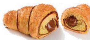
Cornetto Plus Nocciola Alemagna 87 gr