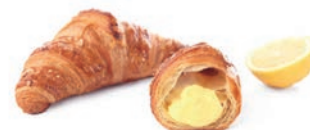
Croissant Crema Pasticcera e Limone Delifrance 90 gr