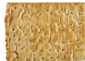
Focaccia Olio Fornaio Maccalli 550 gr