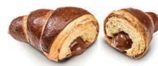
Cornetto In & Out Nocciola Alemagna 87 gr