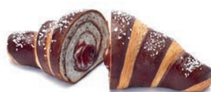
Brunetto Crema di Cacao San Giorgio 90 gr