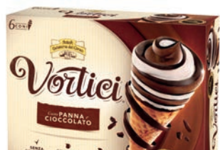
Mpk Cono Vorticci Panna/Cacao 420 gr