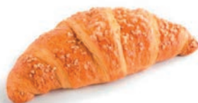
Croissant alla Crema Vandemoortele 90 gr