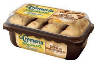
Vaschetta Cremeria Cantucci alla Toscana 500 gr