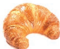
Cornetto Plus Vuoto Decorato Alemagna 72 gr